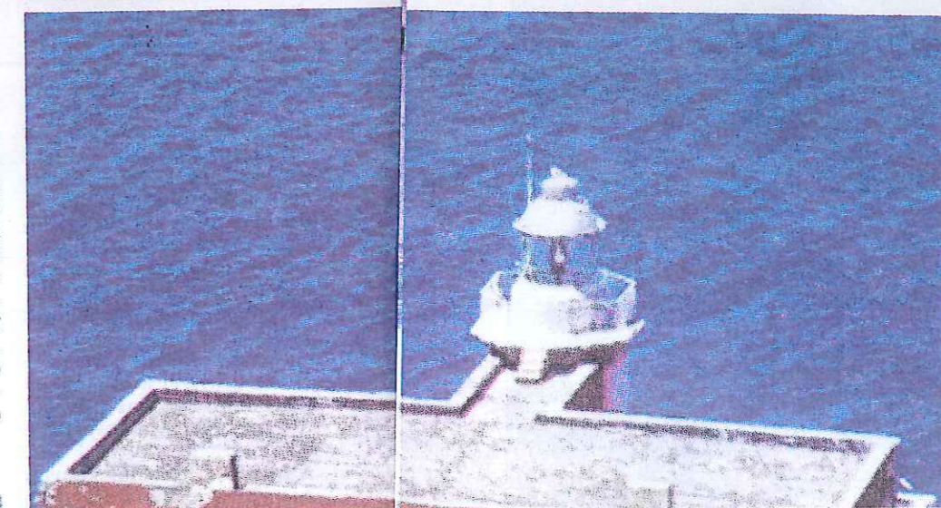
Il faro di Punta del Fenaio a isola del Giglio