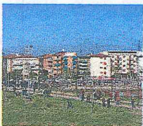
Il Parco centrale