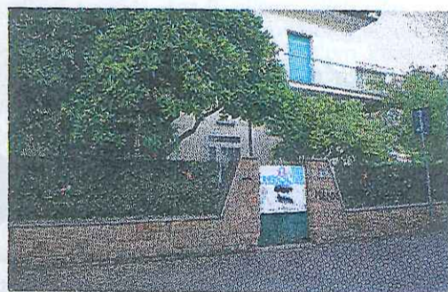
L'asilo finito nella bufera ■ LANDI IN CRONACA

«Più controlli e accreditamento da rivedere»