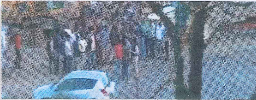
In un video della polizia, i profughi mentre aspettano i caporali